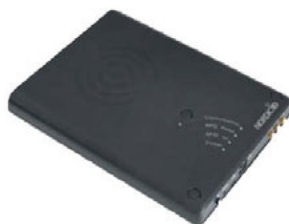
RFID-reader als bureaublad variant