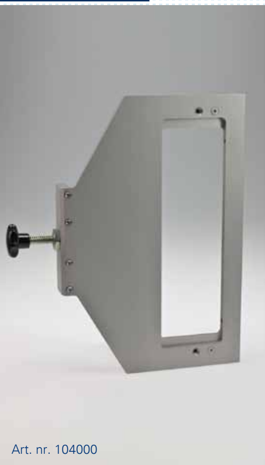
Art. nr. 104000