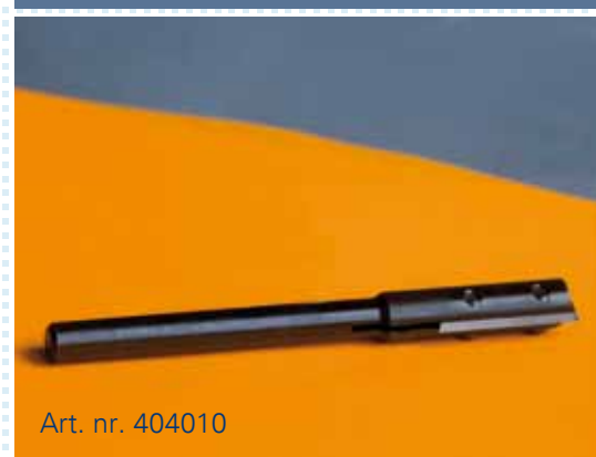
Art. nr. 404010

De HMB Sluitplaatmal is een maatvast gereedschap voor het perfect en snel infrezen van Sluitplaten en Sluitkommen. Het gereedschap bestaat uit een universele Moedermal. In combinatie met verwisselbare Inlegcassettes en een standaard Bovenfreesmachine, is het mogelijk om allerlei soorten Sluitplaten en Sluitkommen binnen enkele minuten uit te frezen.